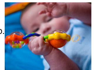
Intentando alcanzar objetos