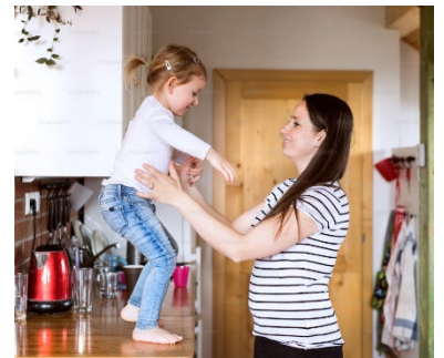
Cuidadora ayudando a una niña a saltar