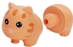
Animalitos que se conectan