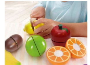
Comida de juego para picar