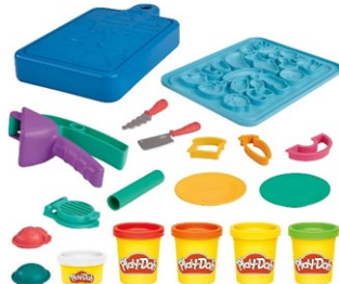
Actividades con plastilina