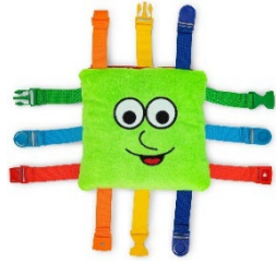
Juguete de hebillas