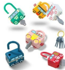
Candados de aprendizaje