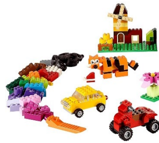
Diseños de Lego