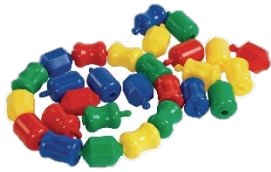
Cuentas Pop Link