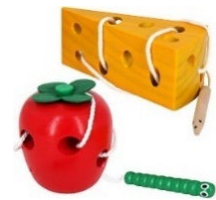
Juguete de madera con cordones