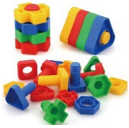
Tuerca y tornillo Huevos que coinciden