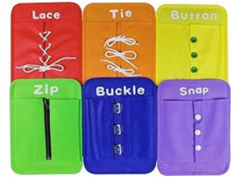
Tablas con sujetadores