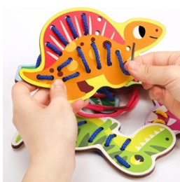
Tarjetas con cordones