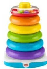
Apilador de aros grandes