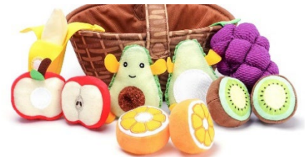
Fruta de peluche con velcro