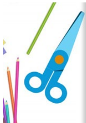
Recortar y colorear