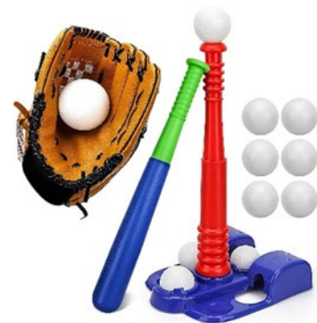
Actividad de béisbol

Servicios de Rehabilitación y Centro N.E.S.T. de Seguimiento del Desarrollo