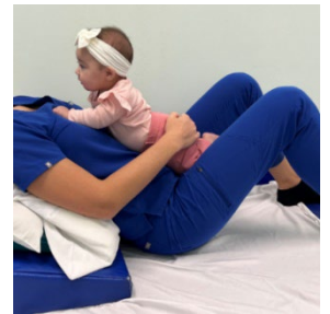
El bebé recostado en el pecho