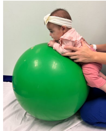
Incline al bebé hacia la pelota