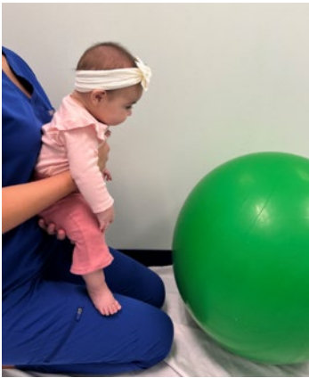
Sostenga al bebé contra su pecho frente a la pelota