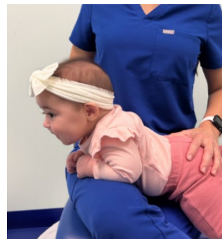
El bebé sobre las piernas cruzadas