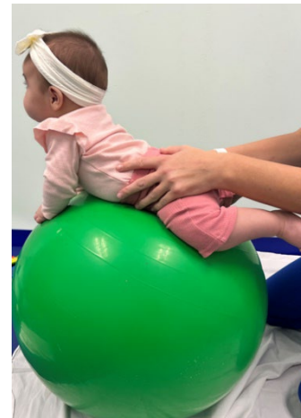
Sostener al bebé en la pelota