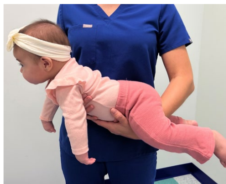
Bebé sostenido por el vientre