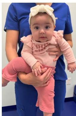
Bebé apoyado contra el pecho del cuidador