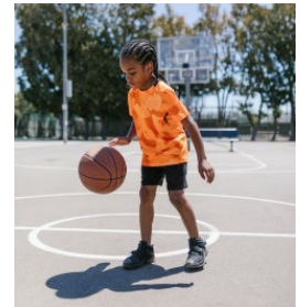
Niño botando la pelota y montando en triciclo