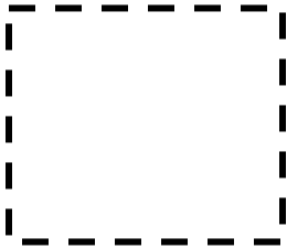
Dibujar forma cuadrada